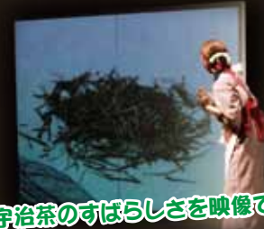
宇治茶のすばらしさを映像で!