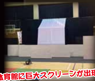
体育館に巨大スクリーンが出現!